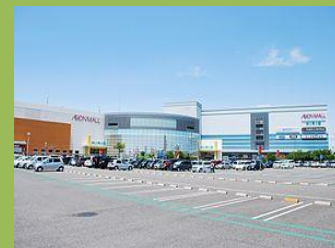
イオンモール木曾川